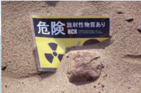
志愿验证日本公共设施辐射安全性