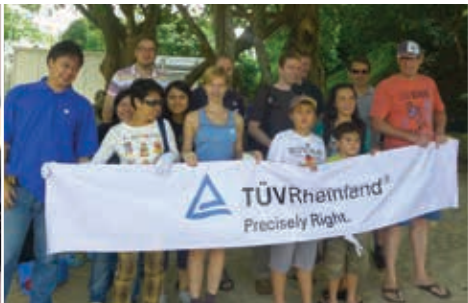
志愿参加海滩清洁