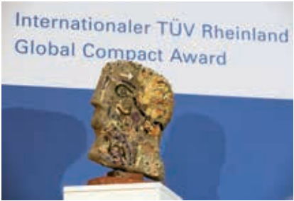
2008年，我们获得“联合国全球契约大奖”。该奖项旨在鼓励长期支持联合国全球契约的机构或个人。

我们长期致力于营造一个同时符合人类和环境需要的美好未来。为此，我们勇于承担责任。德国莱茵TÜV的每一位员工致力于维持技术的可控性和安全性，从而避免其对环境造成危害，一起创造一个安全的工作环境。绿色环保理念已植根于我们的公司使命，同时也鼓励每位员工将可持续发展理念融入日常工作。