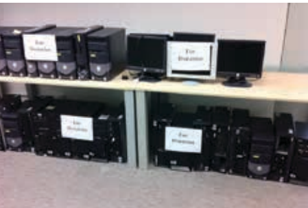
IT产品捐赠给慈善机构