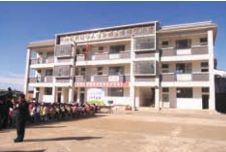
“苗圃行动”云南学校重建项目